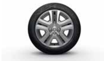
ENJOLIVEUR 16" SARIA