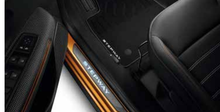
Seuils de porte éclairés avant Stepway

Idéal pour recharger votre téléphone mobile dans le véhicule lors de la conduite. A induction, par simple contact sur le socle de charge. 100% de confort et de simplicité!