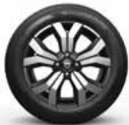
JANTE ALUMINIUM 16" MAHALIA