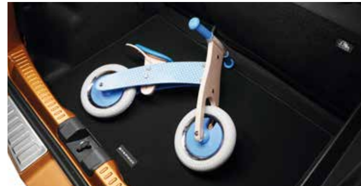
Tapis de coffre Stepway

Apportez une touche d'élégance avec cette antenne requin parfaitement intégrée à la ligne de votre véhicule.