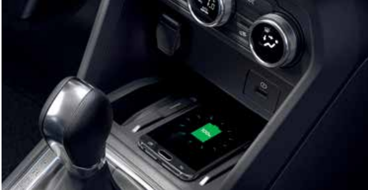
Chargeur de smartphone a induction

Idéal pour recharger votre téléphone mobile dans le véhicule lors de la conduite. A induction, par simple contact sur le socle de charge. 100% de confort et de simplicité!